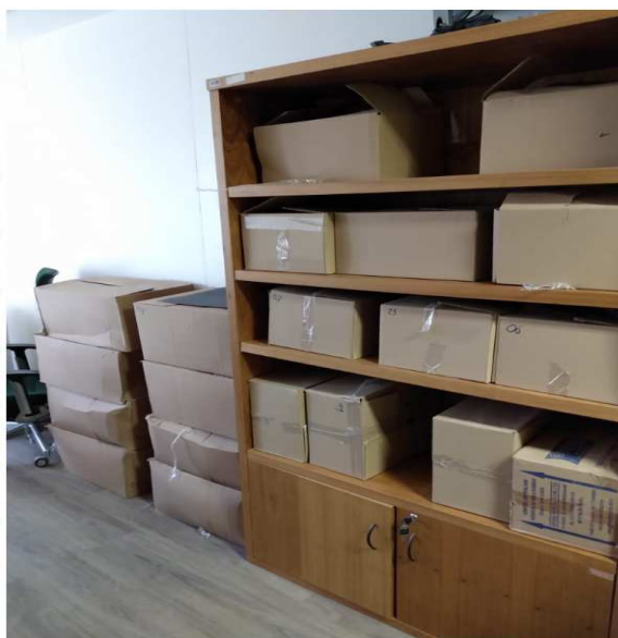
Imagem do material pertencente a 32ª VF-RJ, que foi transportado para o 14º andar.