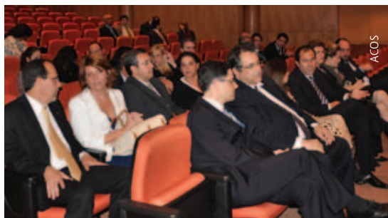
Várias autoridades prestigiaram o evento

Por fim, para o ministro Luís Inácio Lucena Adams, o sistema trará melhorias na eficiência da administração da Justiça no país. “Vamos obter maior transparência, agilidade e eficiência. As ações judiciais vão ser tomadas em tempo útil, com conhecimento praticamente imediato de todas as partes envolvidas no processo”. Para Adams, o novo sistema “permite chegarmos a uma melhor gestão dos conflitos para que possamos atingir o objetivo comum, seja de desembargadores, juizes ou procuradores, que é a implementação da justiça”.