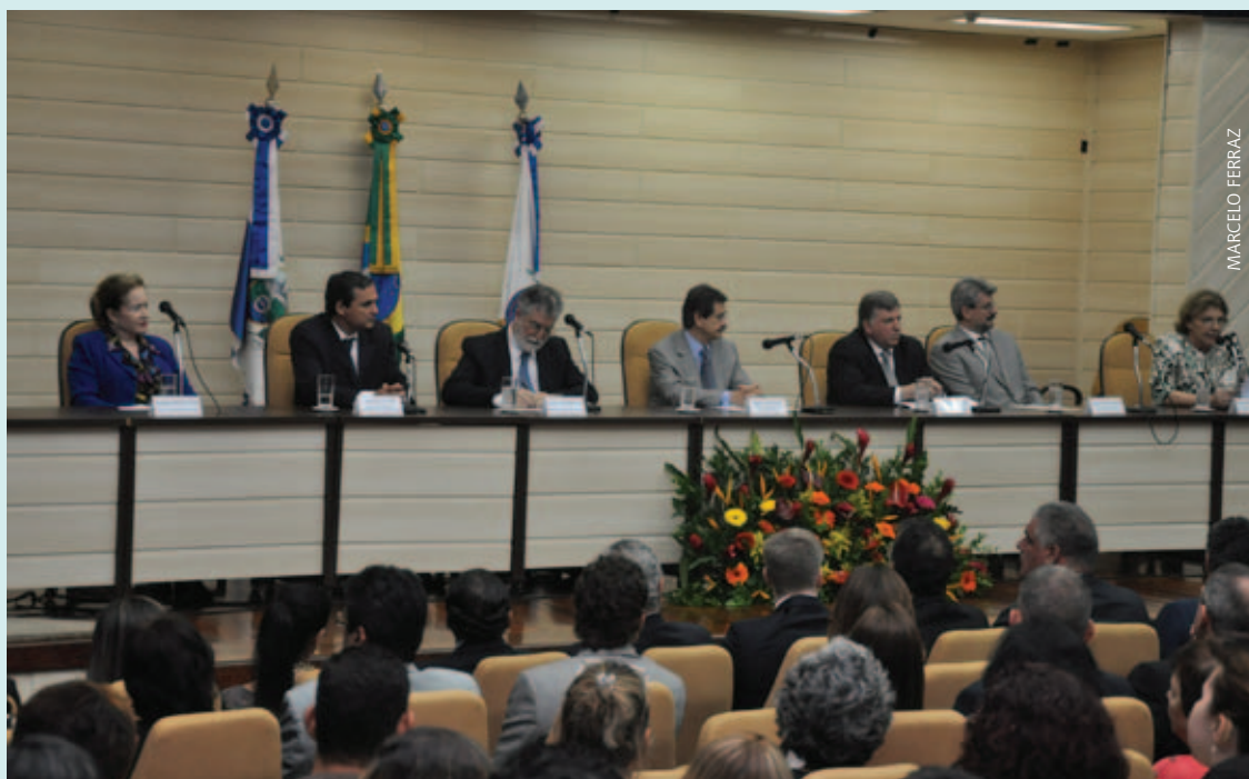
A abertura da Semana Nacional de Conciliação foi presidida pelo ministro Cezar Peluso (ao centro)