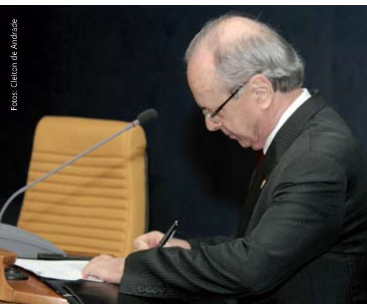
Sergio Feltrin assina o termo de posse

No TRF, além de exercer a atividade judicante, o magistrado foi corregedor regional da Justiça Federal da 2ª Região, durante o biênio 2007-2009, presidente da Comissão de Jurisprudência e da Comissão Temporária de Informática e Estatística. ■