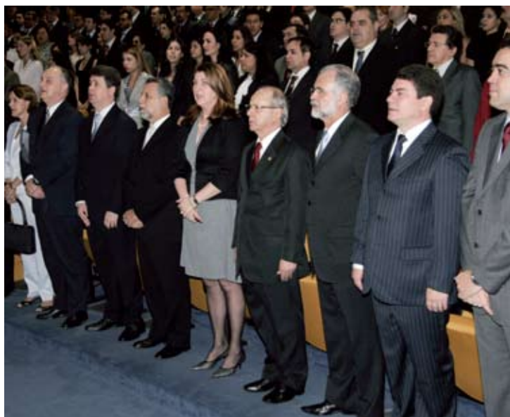
O magistrado entre os empossandos e demais autoridades presentes